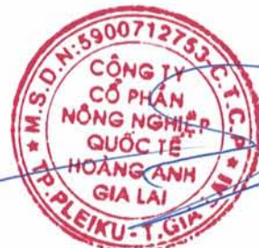
Nguyễn Xuân Thắng