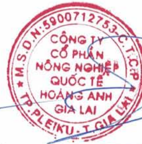
Nguyễn Xuân Thắng