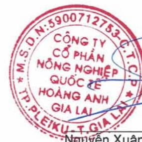
Nguyễn Xuân Thắng