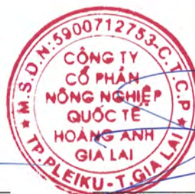
Nguyễn Xuân Thắng